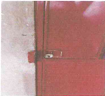
Foto 5: Puertas en mal estado sin chapa y picadas en su mayor parte.