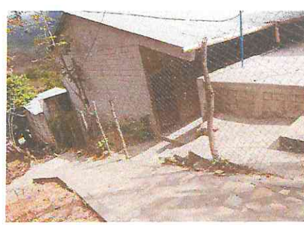
Foto 6: Muro de contención en mal estado con necesidad de remozamiento y colocación de malla galvanizada.

Observación: Si es necesario se pueden agregar hojas adicionales y actualizar el número de hojas.